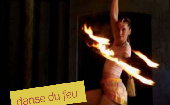
danse du feu