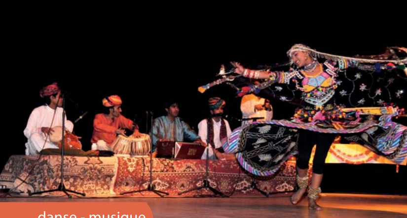
danse - musique